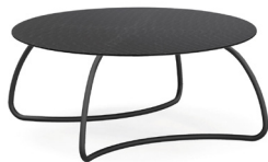
ANTRACITE vern. antracite 44452.00.000