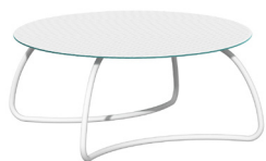
BIANCO vern. bianco 44453.00.000

PT Mesa redonda, Ø172 x 73h cm. Tampo em vidro float temperado, impresso e vitrificado a 700°C. Pernas em alumínio pintado. Com pés antiderrapantes.