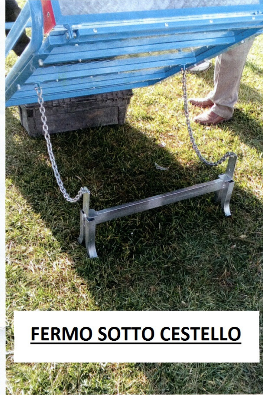
FERMO SOTTO CESTELLO