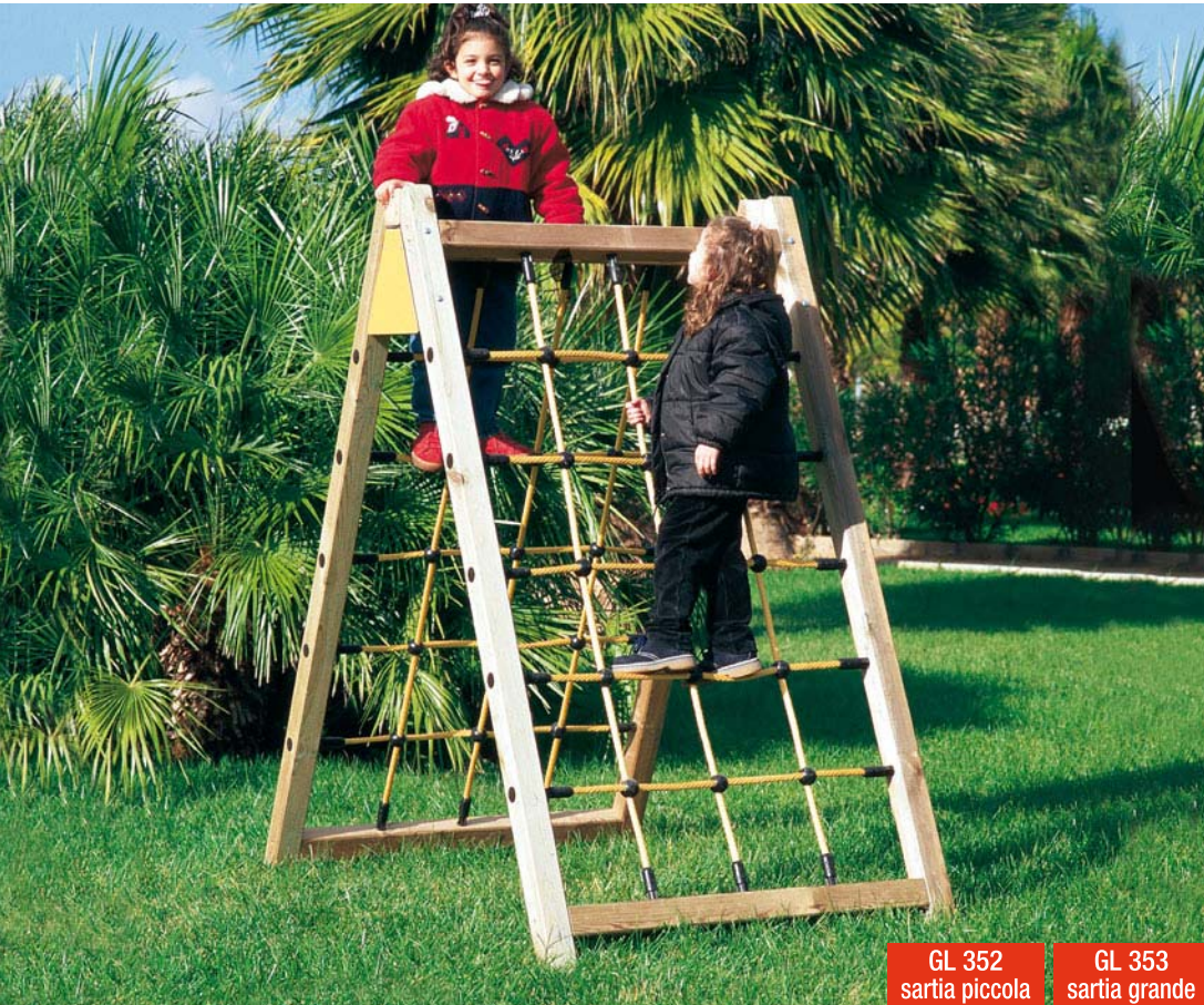
GL 352 sartia piccola